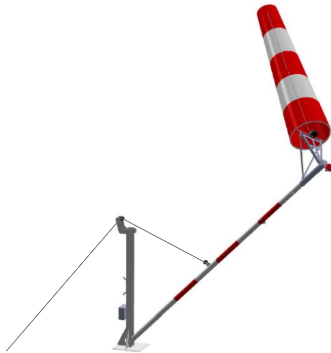
Mât basculant pour maintenance